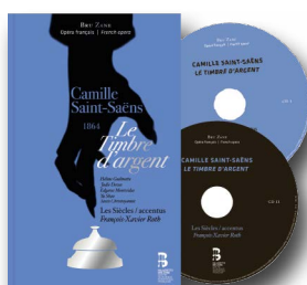
Camille Saint-Saëns Le Timbre d'argent (1864)