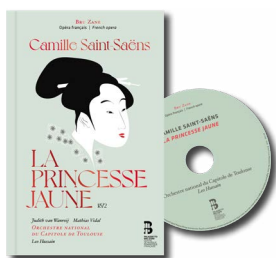
Camille Saint-Saëns La Princesse jaune (1872)

ORCHESTRE NATIONAL DU CAPITOLE DE TOULOUSE