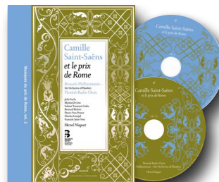
Camille Saint-Saëns et le prix de Rome