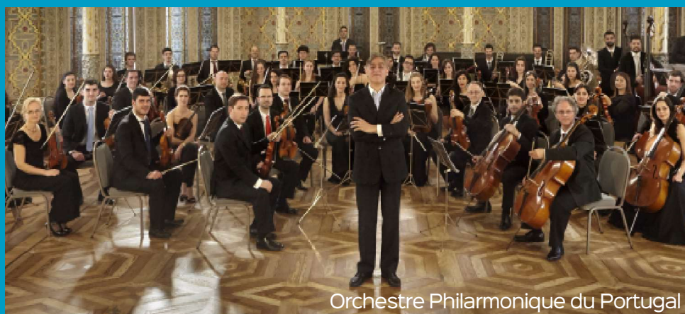
Orchestre Philharmonique du Portugal

Manifestation organisée dans le cadre de la Saison France-Portugal 2022